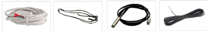
Тип 1 (10К, В=3300) Тип 2 (10К, В=3988) Тип 3 (10К, В=3435) Тип 4 (10К, В=3950)

12.4.9. Контроллер поддерживает датчики давления типа «токовая петля 4-20 мА».