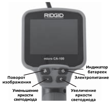
Рис. 2 - Средства управления