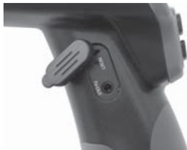
Рис. 9 - Гнездо выхода телевизионного сигнала TV-OUT/Кнопка сброса “Reset”

Вставьте другой конец кабеля в гнездо видеовхода телевизора или видеомонитора. Возможно, для просмотра изображения на телевизоре или видеомониторе придется включить соответствующий вход видеосигнала.