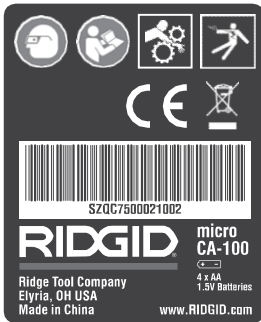
Рис. 7 - Предупредительная этикетка