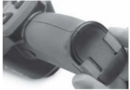
Рис. 3 - Крышка батарейного отсека