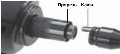
Рис. 5 - Кабельные соединения

Для увеличения длины кабеля прибора до 30 футов в комплекте имеются удлинительные кабели длиной 3 и 6 футов. Чтобы подсоединить удлинительный кабель, сначала отсоедините кабель головки видеокамеры от дисплейного блока, отвернув цилиндрическую ручку с накаткой. Подсоедините удлинительный кабель к переносному дисплею, как описано выше (рис. 5). Присоедините конец с ключом кабеля головки видеокамеры к концу с прорезью удлинительного кабеля и от руки затяните цилиндрическую ручку с накаткой для фиксации соединения.