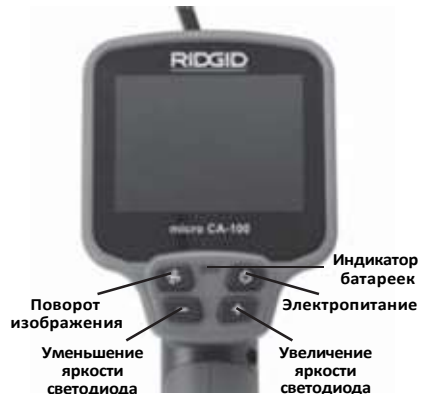
Рис. 8 - Средства управления