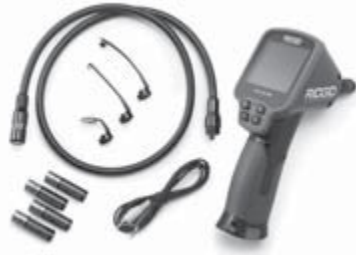
Рис. 1 - Инспекционная видеокамера micro CA-100