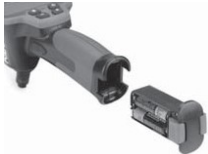
Рис. 4 - Батарейный отсек