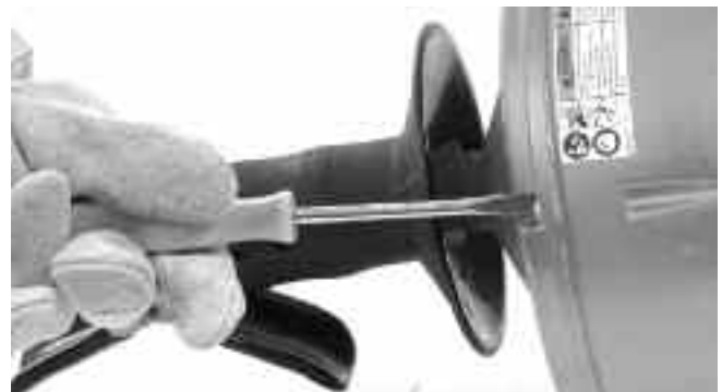
Рис. 13 – Слегка отверните 4 винта барабана примерно на 3 полных оборота, но не извлекайте их