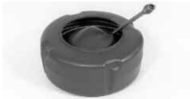
Рис. 16 – При загрузке троса во внутренний барабан трос необходимо наматывать ПО ЧАСОВОЙ СТРЕЛКЕ.