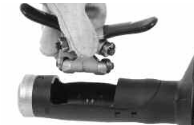
Рис. 12B – Снятие механизма автоподачи AUTOFEED с корпуса