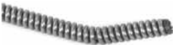
Рис. 15 – Согнутый конец троса