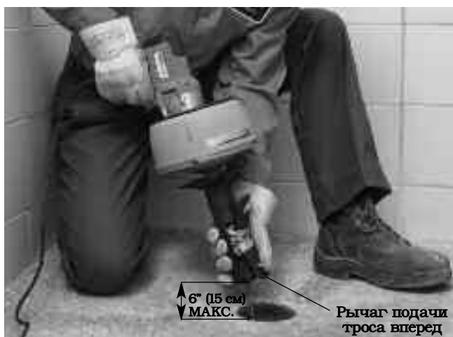
Рис. 10 – Автоматическая подача троса в режиме AUTOFEED

Проверьте, что трос на длину не менее 30 см (12") введен в канализационную трубу, а выход троса из инструмента для чистки канализации располагается на расстоянии не более 30 см (6") от входного отверстия канализационной трубы. Переместите рукоятку в сторону от барабана, чтобы освободить трос в зажимном патроне. Запрещается включать зажимной патрон в режиме автоподачи AUTOFEED. Для пуска инструмента включите тумблер электропитания ON/OFF. Чтобы переместить трос вперед в канализационную трубу, нажмите рычаг подачи вперед. Вращающийся трос начнет поступать в канализационную трубу. Не следует допускать накручивания, изгиба или искривления троса перед входным отверстием канализационной трубы. Это может привести к перекручиванию, перегибу или обрыву троса.