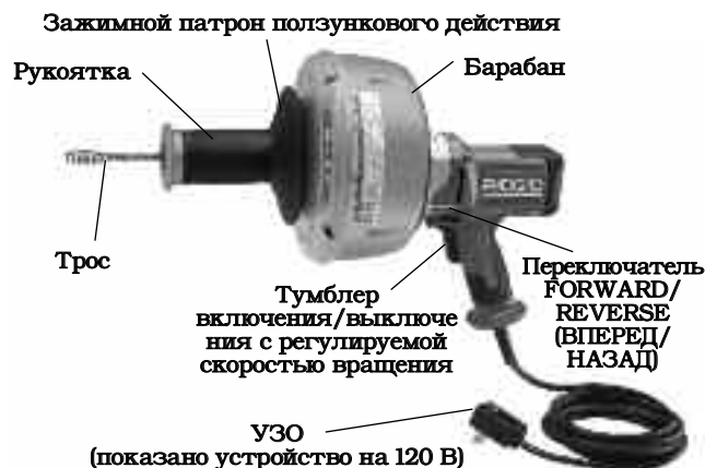
Рис. 1 – Инструмент для чистки канализации К-45 с зажимным патроном ползункового действия

Перечень выпускаемых тросов с указанием их длины приведен в разделе "Дополнительные принадлежности"