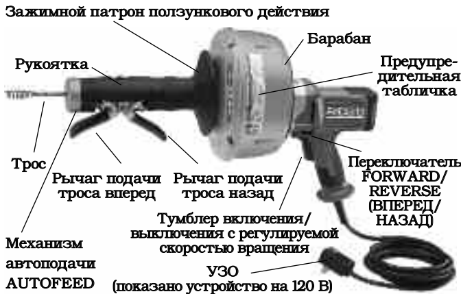
Рис. 2 – Инструмент для чистки канализации К-45 AF с автоподачей AUTOFEED