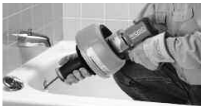
Рис. 9 – Протолкните трос дальше в канализационную трубу