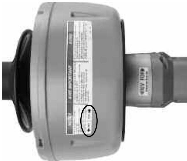
Рис. 5 – Этикетки ВПЕРЕД/НАЗАД (FOR/REV)

8. Не нажимайте рычаги подачи инструмента (только на инструментах с автоподачей AUTOFEED). Нажмите тумблер включения питания (ON/OFF) и определите направление вращения барабана по сравнению со стрелками ВПЕРЕД/НАЗАД (FOR/REV) на наклейках. Если тумблер выключения питания (ON/OFF) не управляет работой инструмента, не используйте инструмент для чистки канализации до тех пор, пока тумблер не будет отремонтирован. Отпустите тумблер и дождитесь полной остановки барабана. Переместите переключатель ВПЕРЕД/НАЗАД (FOR/REV) в другое положение, и повторите описанную выше процедуру проверки правильности вращения инструмента для чистки канализации в обратном направлении.