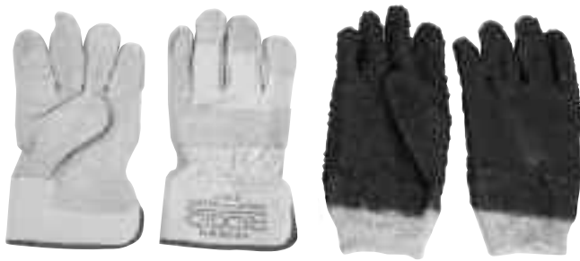
Рис. 4 – Рукавицы RIDGID для чистки канализации – кожаные и из ПВХ