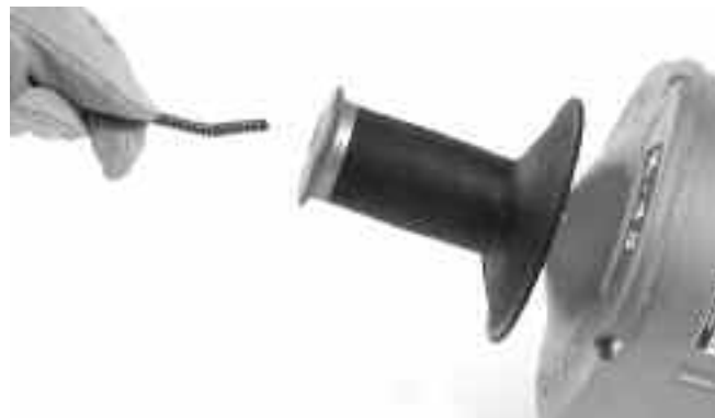
Рис. 17 – Загрузка троса без замены внутреннего барабана