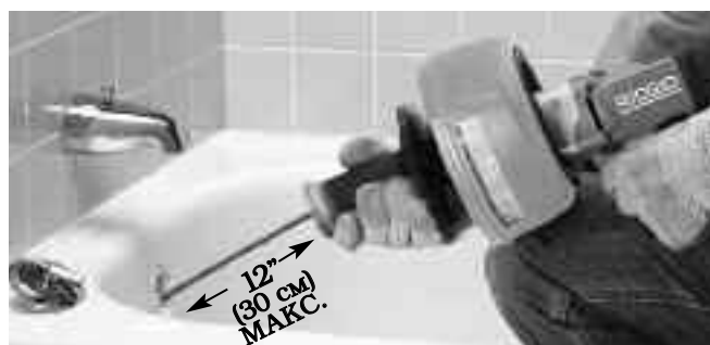
Рис. 8 – Переместите рукоятку в сторону к барабану, чтобы зажать трос зажимным патроном

Если подача кабеля вперед затрудняется, для улучшения захвата и подачи троса можно использовать зажимной патрон. Переместите рукоятку в сторону к барабану, чтобы зажать трос в зажимном патроне. Во время вращения троса (тумблер ON/OFF включен в положение ON) переместите инструмент для чистки канализации к входному отверстию канализационной трубы, чтобы протолкнуть трос внутрь. Отпустите тумблер включения-выключения питания (ON/OFF). Переместите рукоятку в сторону от барабана, чтобы освободить трос в зажимном патроне. Рукой, на которой надета рукавица, захватите трос во избежание его выскакивания наружу из канализационной трубы и переместите инструмент для чистки канализации назад так, чтобы на воздухе находилось не более 12" (30 см) троса. Повторяйте вышеуказанные операции, продолжая таким образом перемещать трос вперед. (См. рис. 8-9.)