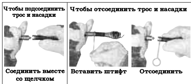
Рис. 7 – Подсоединение и отсоединение насадок

При использовании удлинительного шнура питания следует учитывать, что УЗО в инструменте для чистки канализации не обеспечивает защиту для удлинительного шнура. Если электрическая розетка не оборудована УЗО, рекомендуется использовать вилку с защитой УЗО между розеткой и удлинительным шнуром питания, чтобы снизить опасность поражения электрическим током в случае неисправности удлинительного шнура.