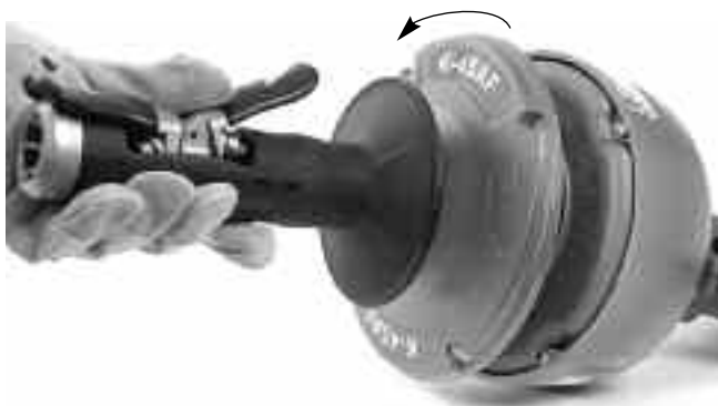
Рис. 14 – Проверните и отделите крышки барабана