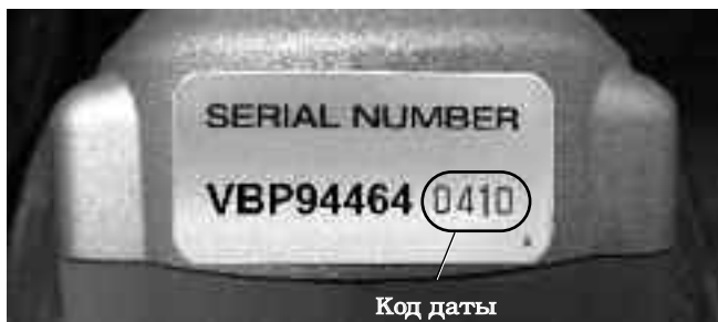
Рис. 3 – Серийный номер инструмента

Серийный номер электроинструмента указан снизу на его корпусе. Последние 4 цифры обозначают месяц и год его выпуска. (04 = месяц, 10 = год).