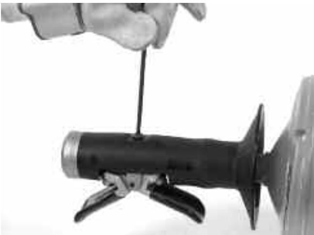
Рис. 12A – Отворачивание винта автоподачи AUTOFEED